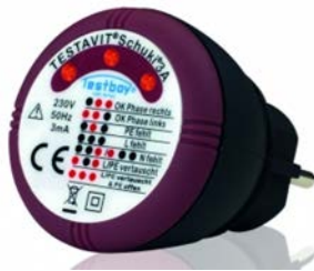
Messhilfsmittel für Schutzleiterprüfung